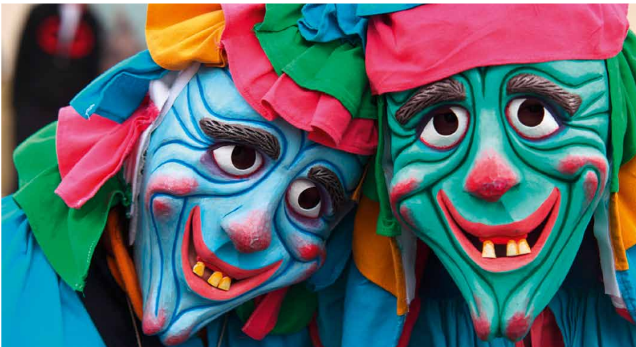
Verkleidete Karnevalsbesucher: Sperrige Kostüme bei der Autofahrt sind ein Unfallrisiko

Nicht in jedem Fall sind die Ordnungshüter so tolerant. Alkohol am Steuer ist ein absolutes Tabu. Wie zu jeder anderen Jahreszeit gilt: Wer mit 0,5 Promille oder mehr am Steuer von der Polizei erwischt wird, bekommt mindestens 500 Euro Strafe, vier Punkte in Flensburg und mindestens einen Monat Führerscheinentzug. Karnevalsjecken sollten besser auf Bus und Bahn umsteigen. Vor allem, wenn sie sich aufwendig verkleidet haben. Schränkt das Kostüm die Sicht, das Gehör oder die Bewegungsfreiheit eines Fahrers ein, erhöht dies die Unfallgefahr. Wer voll kostümiert in eine Polizeikontrolle gerät, muss mindestens zehn Euro Strafe zahlen. Wegen grober Fahrlässigkeit kann aus einer Maskierung sogar der Verlust des Versicherungsschutzes folgen. Doch wer beim Feiern etwas aufpasst, macht sich nach dem Karneval nicht zum Narren. ●