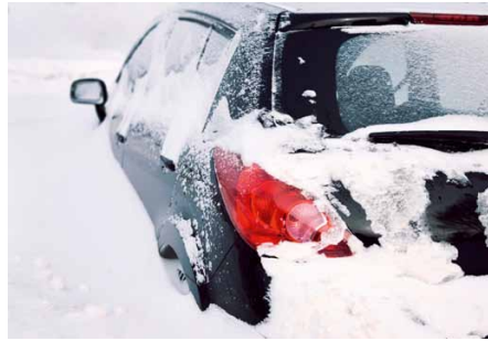
Auto im Schnee: Winterreifen sind Pflicht