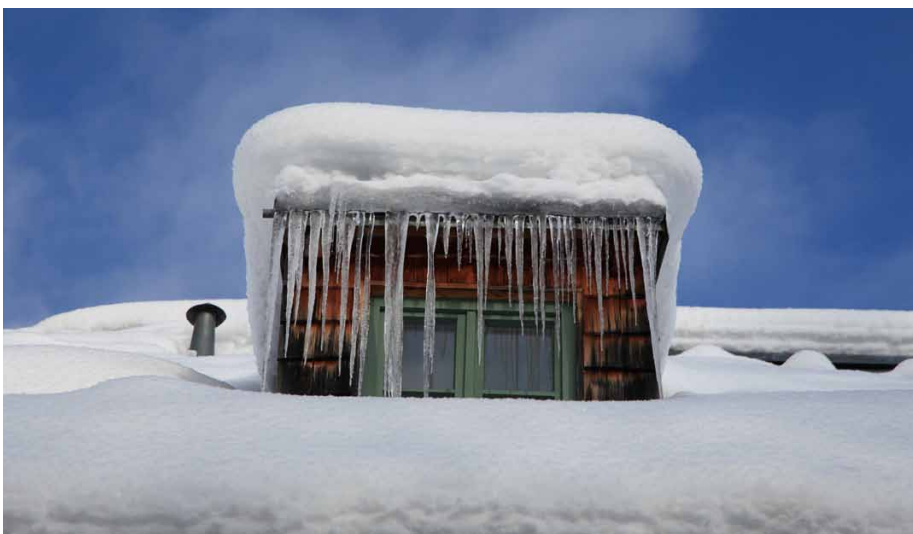
Eis und Schnee: Hauseigentümer müssen ihrer Verkehrssicherungspflicht nachkommen